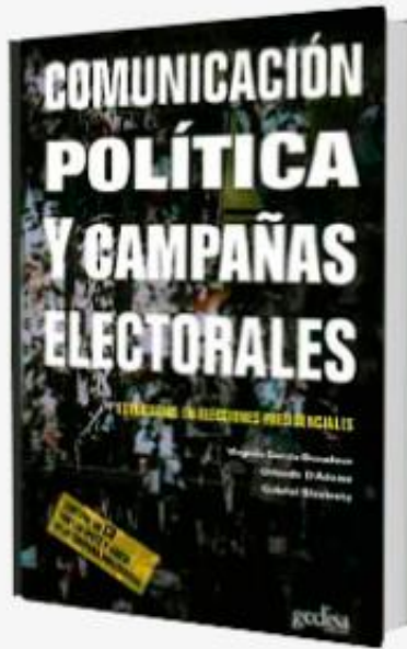
Comunicación política y Campañas electorales