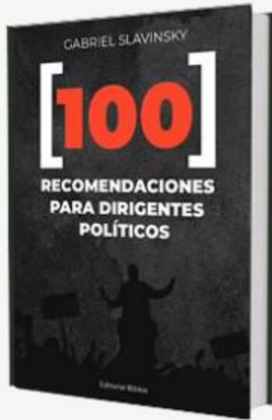
100 recomendaciones para dirigentes políticos

https://gabrielslavinsky.com.ar/publicaciones/